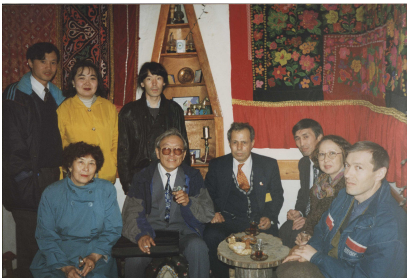
V Курултай тюркских государств и народов 12 июня 1997 г. г. Стамбул.