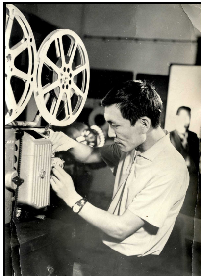
Первая работа – проявщик на Абаканской студии телевидения, 1962 г.