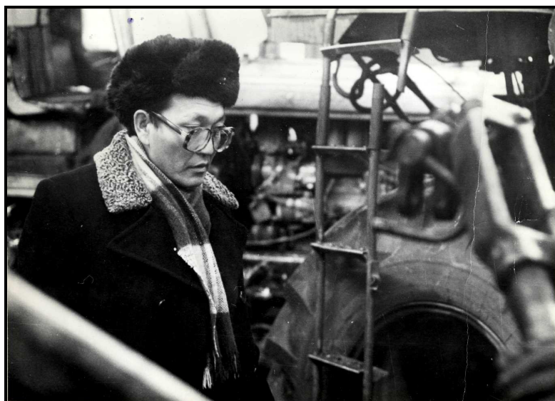
И в кабинете и на производстве, 1992 г.