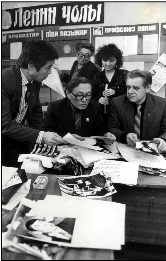
Главный редактор национальной газеты «Ленин чолы», 1986 г.