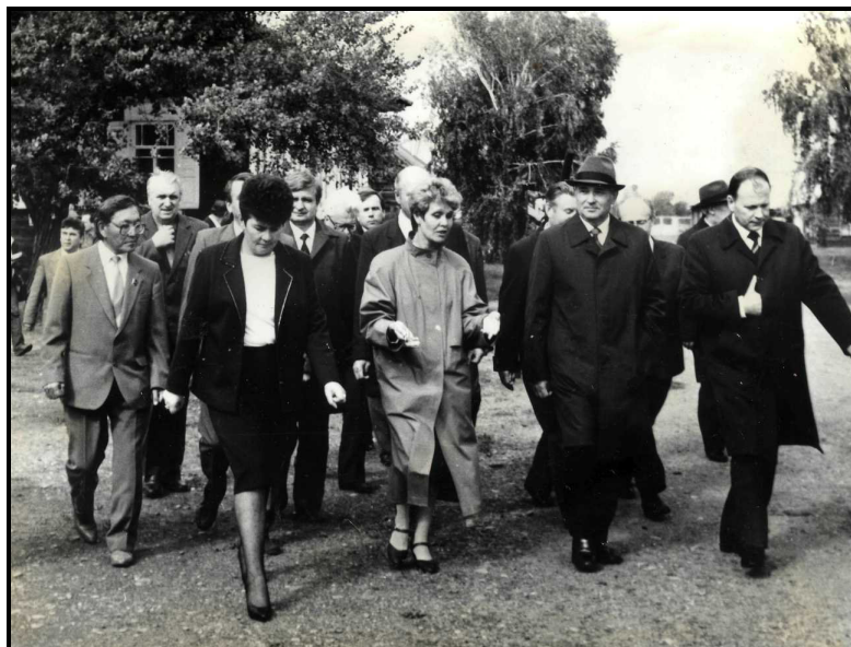
Приезд М.С. Горбачева в Хакасскую автономную область, 1989 г.